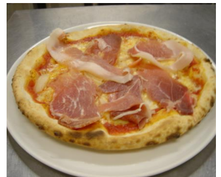
生ハムモッツァレラ