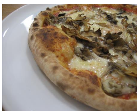
ファーム(季節の野菜)