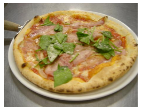
ベーコン(蔵王ベルツ)